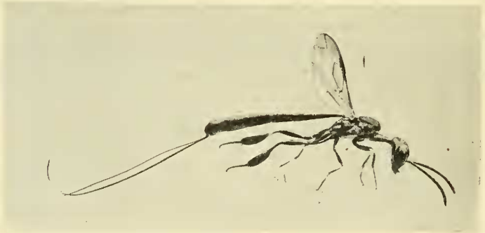
Gasteruption tenue Kieffer

♀. Noir; propleures, écailles, une bande oblique sur la limite des mésopleures et des métapleures roux brun; quatre pattes antérieures brunes, genou, tibia, sauf le côté ventral et tarse, sauf les quatre derniers articles du tarse intermédiaire, blancs; patte postérieure noire, avec un large anneau blanc, au-dessus de la base des tibias. Bouche et palpes jaunâtres, mandibules à dents noires, conformées comme chez G. valens (fig. 64, Evaniidae , pag. 337), sauf que la dent supérieure est droite. Corps très grêle. Tête très allongée, mate, finement chagrinée; occiput presque aussi long que large, graduellement aminci en arrière, à bord postérieur un peu relevé mais sans collerette. Yeux allongés, glabres, distants du bord occipital de deux tiers de leur lon-